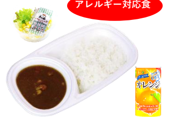
アレルギー対応カレーセット 1,200円