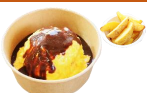
オムライス ポテト付き