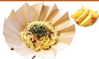
和風きのこスパゲッティ ポテト付き