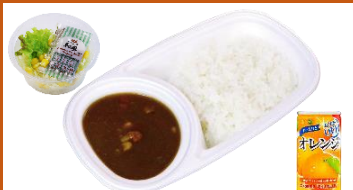
アレルギー対応カレーセット