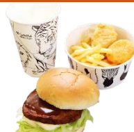
ハンバーガーセット