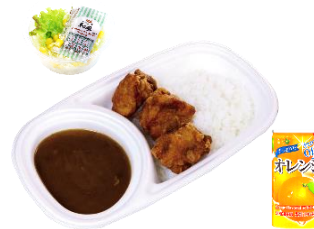
から揚げカレーセット 1,300円