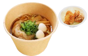
しょうゆラーメン 唐揚げ付き