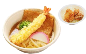
うどん 唐揚げ付き