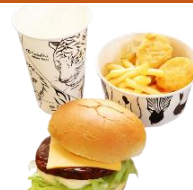
チーズバーガーセット