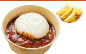
ハヤシライス ポテト付き