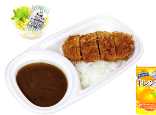
カツカレーセット 1,400円