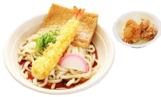
冷やしうどん 唐揚げ付き