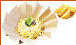
カルボナーラスパゲッティ ポテト付き